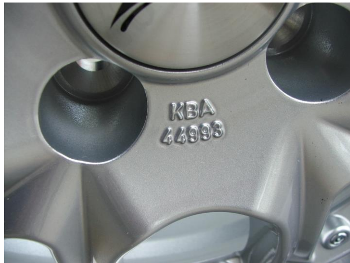
Umiestnenie schvaľovacej značky KBA na diskovom kolese