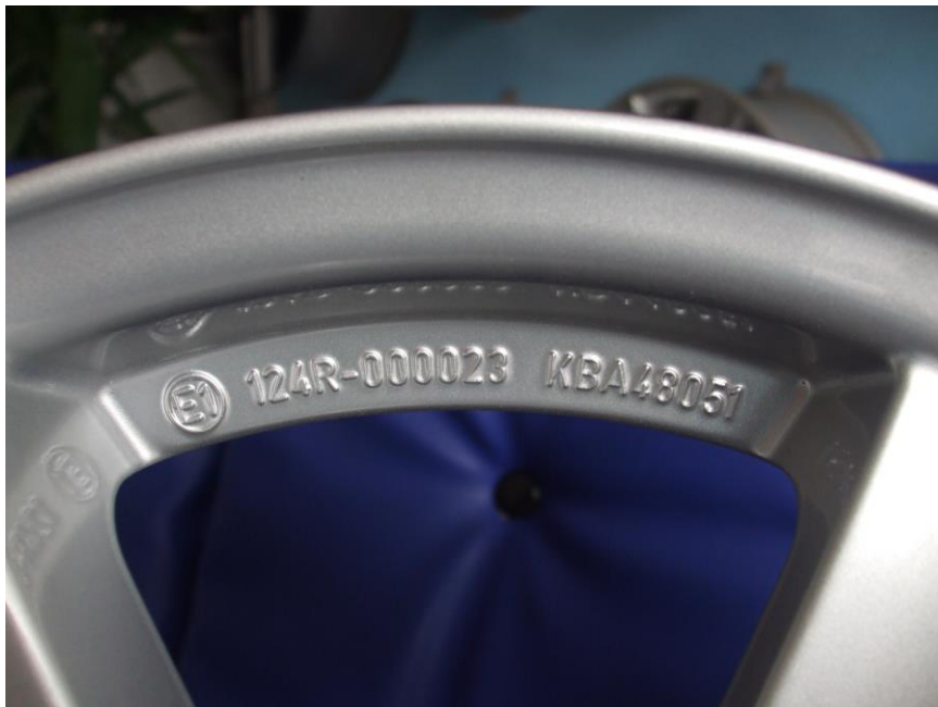
Príklad umiestnenia homologizačnej značky na diskovom kolese.

Umiestnenie homologizačnej značky na kolese môže byť rôzne, pričom štandardne sa značka umiestňuje na viditeľnú plochu diskového kolesa.